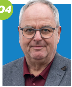
JOSEF KLAUS (63) Erster Bürgermeister Kreisrat Niederaichbach