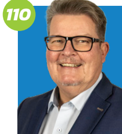
110 DIETER NEUBAUER (60) Dipl.-Verwaltungswirt (FH) Erster Bürgermeister Kreisrat Verwaltungsrat Lakumed Essenbach